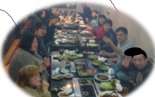
写真はみんなで焼き肉のイメージ写真です。今月はリーゼントで決めてみました。

全国の和紙の展示、販売が行われているそうです。紙漉き体験もあるようですが、時間が無いかな？