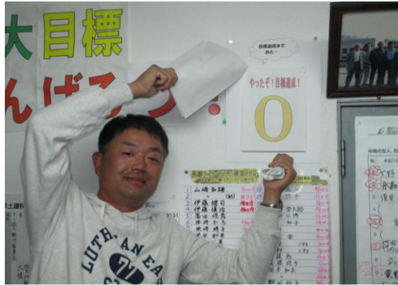
拡大カウントダウンで0に!

みなさまのおかげで2名 超過で達成しました。 連日の拡大行動ご苦労さ までした。支部全体でも目標 を達成できましたが、全分会 達成はできませんでした。支 部全体でよく頑張ったと思 います。 年間拡大は16名残って いますが、1名でも多く縮め ていききたいと思っています。