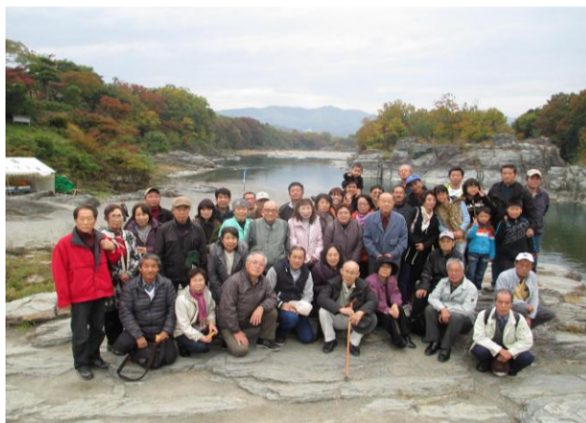
岩畳の上で記念写真

小松沢農園へ到着すると、もちつきを行い、すかさずマス釣りチームと別れました。マス釣りは1匹釣れたら終了なんです。コツをつかむまで結構時間がかかりました。釣ったマスはその場で塩焼きにでき、塩加減もよく焼けて美味しかったです。そのあとは、待ちに待ったバーベキューです。いろいろ歩いてお腹も空いているので、ビールやお肉はどんどん無くなりまりました。そうしているうちに、空も青空になり太陽が見えていました。