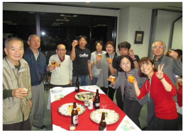
支部会館で拡大打ち上げ