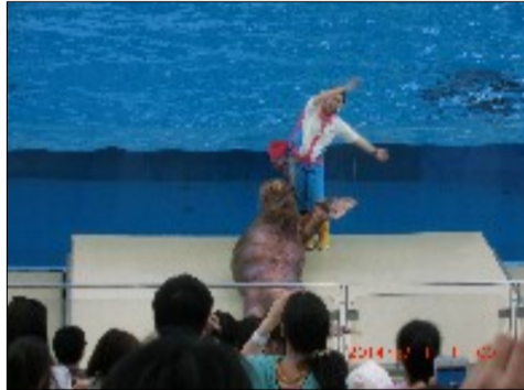
海の動物たちのショーから セイウチの腰ふりダンス