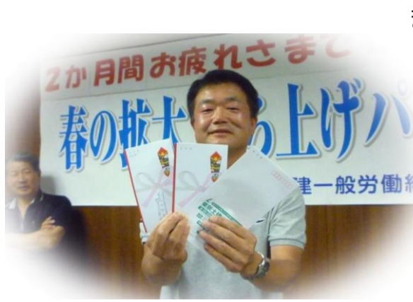
達成&3番乗り祝い金

ま少加のみつじダ 月 し入おまもにッ え間 4 づが蔭しの始シごの月 。つパもたごま ャた 拡か ゴラあ。とりも分大ら ーパリ、書くまよ会月始 ルラ、記中しくは間ま にと事の盤たが、いー 2 近あ業森でが、いー ケ づり所さ苦、いー き、のんしい感ト