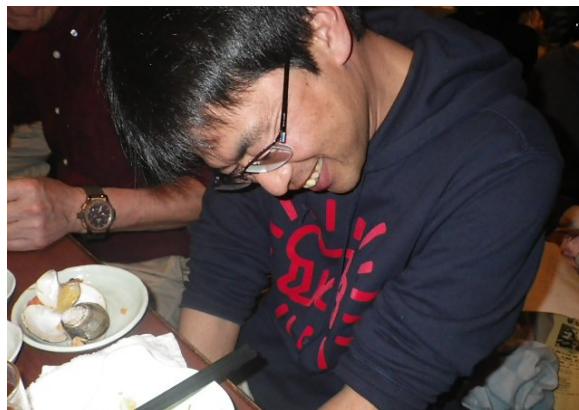
1面にも載りましたが、こーちゃんです。 じつは、Tシャツまでガックリしてました。