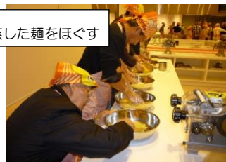
⑧蒸した麺をほぐす