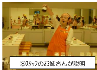
③スプのお姉さんが説明