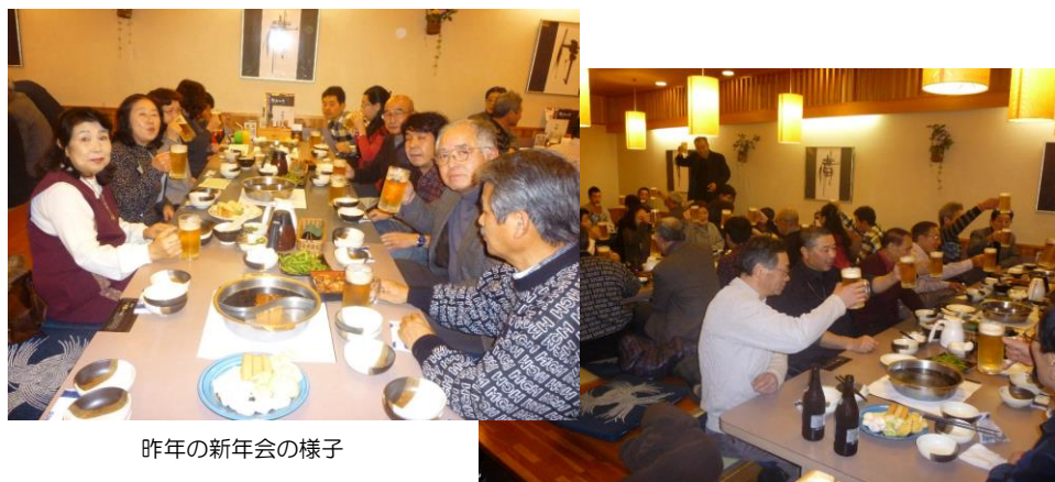
昨年の新年会の様子

日時：平成27年1月25日(日) 18:00~20:00 場所：どん亭 江古田店