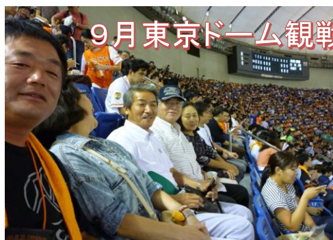
9月東京ドーム観戦