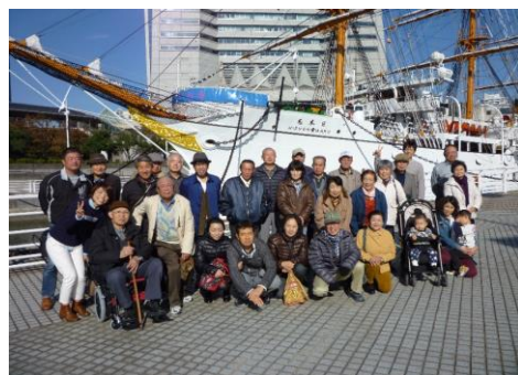
日本丸で記念撮影