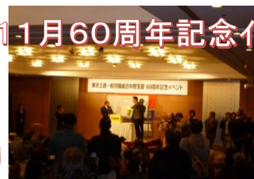
11月60周年記念イベント