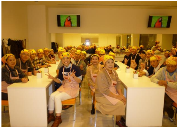
まるで仮想パーティー(笑)

まず、髪の毛が入らないようにバンダナをする。チキンラーメンの「ひよこちゃん」がプリントされたバンダナ。誰一人恥ずかしくないことなく装着。けど、笑える。男性陣は特に笑える。ハローウィンは終わったはずだが、笑える。笑える。笑える。