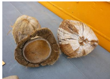
日本丸の甲板にヤシの殻何に使用するのでしょうか？

まず、髪の毛が入らないようにバンダナをする。チキンラーメンの「ひよこちゃん」がプリントされたバンダナ。誰一人恥ずかしくないことなく装着。けど、笑える。男性陣は特に笑える。ハローウィンは終わったはずだが、笑える。笑える。笑える。