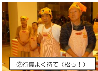
②行儀よく待て(松っ！)