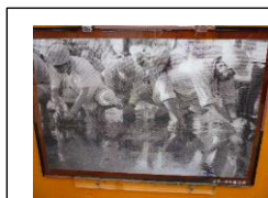
前ページのクイズの答え