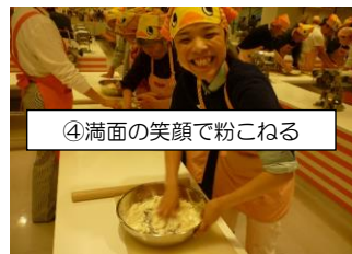
④満面の笑顔で粉こねる