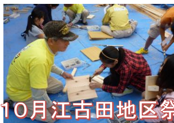
10月江古田地区祭り