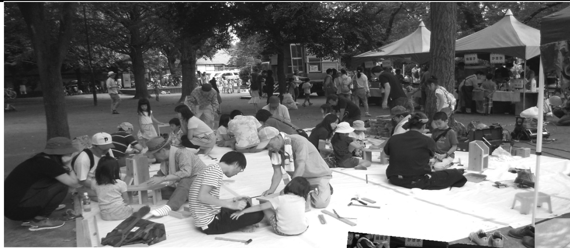
▲木工作のスペースは盛況です！

参加してくれた組合員の姿を並べてみると、楽しかったよ。私たちがしゃべると、笑顔がいっぱいでした。