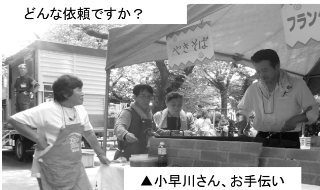
▲小早川さん、お手伝い 有難うございます！