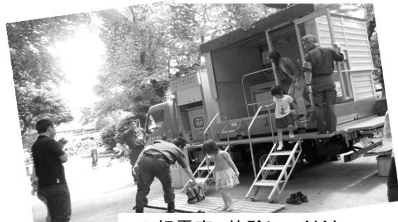
▲起震車、体験してください！