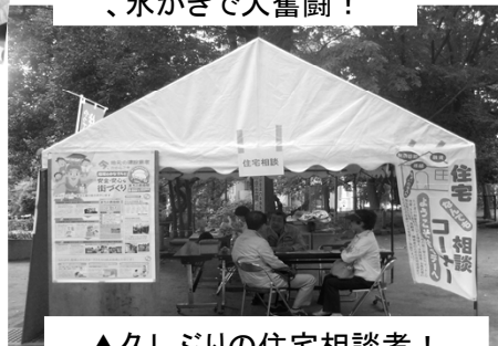
▲久しぶりの住宅相談者！ どんな依頼ですか？