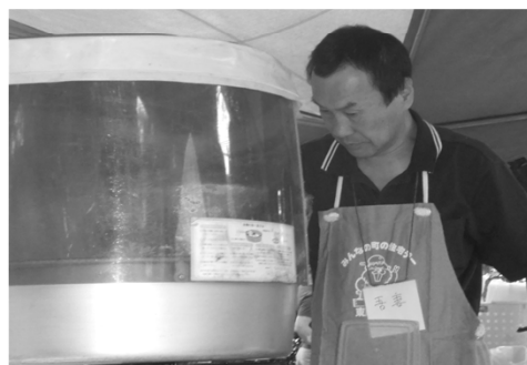
▲吾妻書記さん、綿菓子の作り方の フォローもなく悪戦苦闘、お疲れさんです！