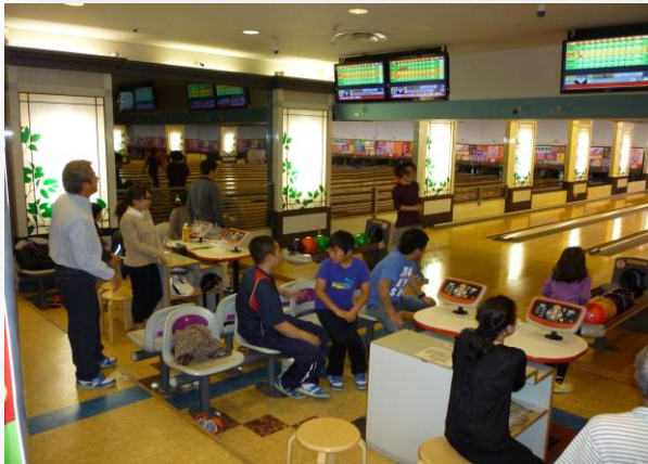
ゲーム中はスコアに夢中