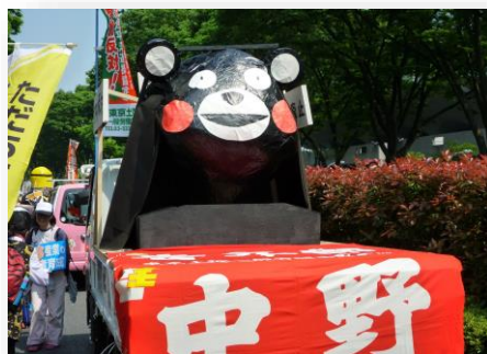
中野支部のくまモン

労働者の祭りの メーデー。朝は肌寒 い気温でしたが、昼 に近づくと暑いつつ、 太陽が出て暑い天候 になりました。 経由の青山コースで、 中野支部のくまモン でした。