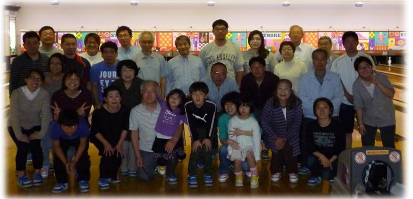
ゲーム開始前に全員で集合写真

ボウリング大会。参加の は32名でした。参加 ゲームが始まると、 スコアというより楽し く投げようという雰囲気 でした。というより楽し くとにかく久しぶりの ボウリングスコアは散々な 状態でした。 2ゲームを終えて、 宴会場の「香港亭」へ 移動。 宴会は放っておいて も盛り上がり、表彰式 を忘れそうでした。