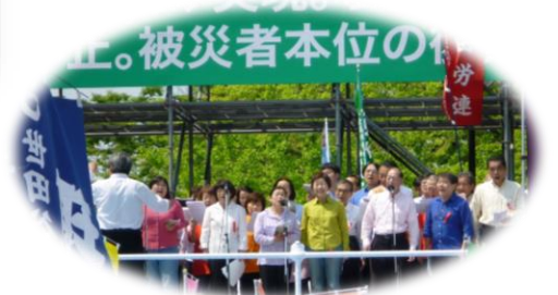
えごたの歌姫が中央に・・・ わかりづらいな・・・ 小さすぎたね・・・

労働者の祭りの メーデー。朝は肌寒 い気温でしたが、昼 に近づくと暑いつつ、 太陽が出て暑い天候 になりました。 経由の青山コースで、 中野支部のくまモン でした。