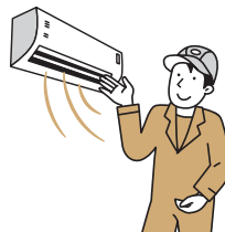
給湯器やエアコンといった設備を省エネ用の高性能なものに交換

省エネ設備の交換や建物自体の冷暖房効果を高めることで、必要なエネルギー消費を抑えることが可能です。断熱性能が高く、暖かい『省エネ住宅』は、住まい手の健康づくりにもつながります。